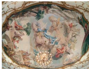
Leopold Mozart, der Vater von Wolfgang Amadé, wurde in Augsburg geboren. Diese Stadt prägte den Geschmack des Rokoko.